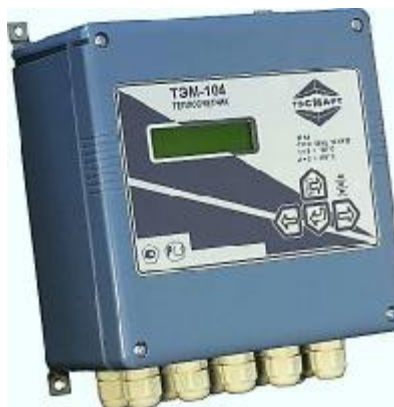
Рисунок 2. Внешний вид ИВБ

Типы ТС, ИП и ДИД применяемые в составе теплосчетчика, указаны в Таблицах 1, 2, 3.