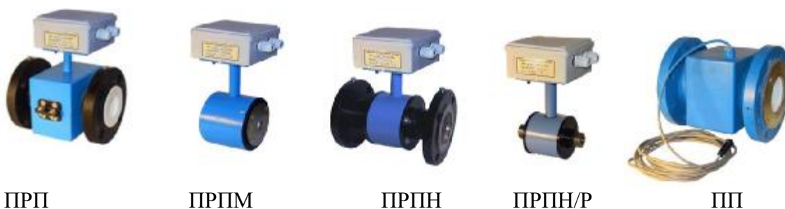
Рисунок 1. Внешний вид ППР

Типы и внешний вид ППР и ИВБ приведены на рисунках 1 и 2.