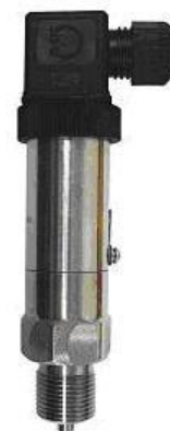
Рисунок 1г - ППД