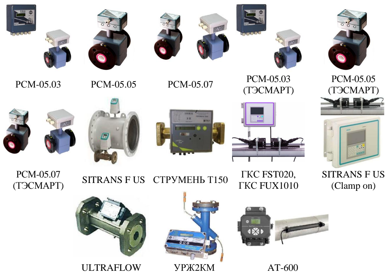
Рисунок 4.1 - Общий вид ИП, применяющихся для измерений объёма теплоносителя