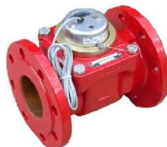
BCSH, BSTH, BCGH