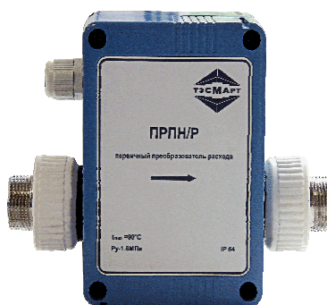
Рисунок 1в - ПРПН/Р