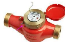
BCKM 90 "ATLANT", OSB "NEPTUN"