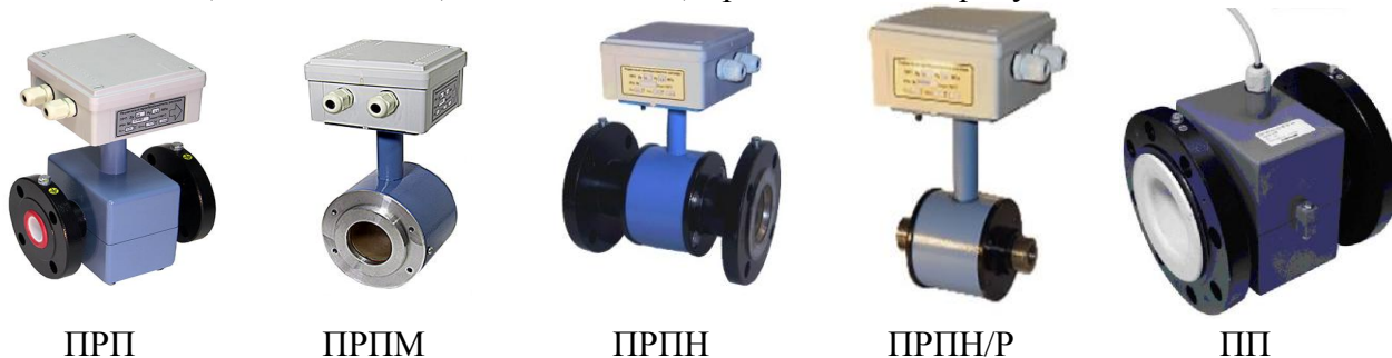
Рисунок 1а - ППР

Схема пломбировки от несанкционированного доступа теплосчётчиков ТЭСМА-106 модификации ТЭСМА-106(ТЭСМАРТ.01), ТЭСМА-106(ТЭСМАРТ.02.1), ТЭСМА-106(ТЭСМАРТ.02.2), ТЭСМА-106(ТЭСМАРТ.02.3) представлена на рисунке 2.