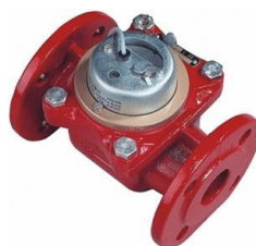
BCGH, BCGHd, BCSH, BCSHd