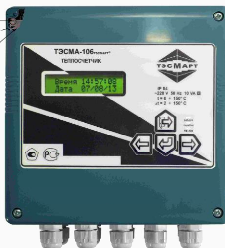
Рисунок 2 - Схема пломбировки от несанкционированного доступа

Контакты, разрешающие программирование микроконтроллера (защищено экраном)