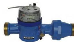
CB-32, CB-40 СТРУМЕНЬ