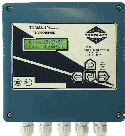
Рисунок 1б - ИВБ