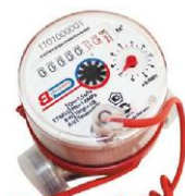
ETKI (ETWI) VINDAKS