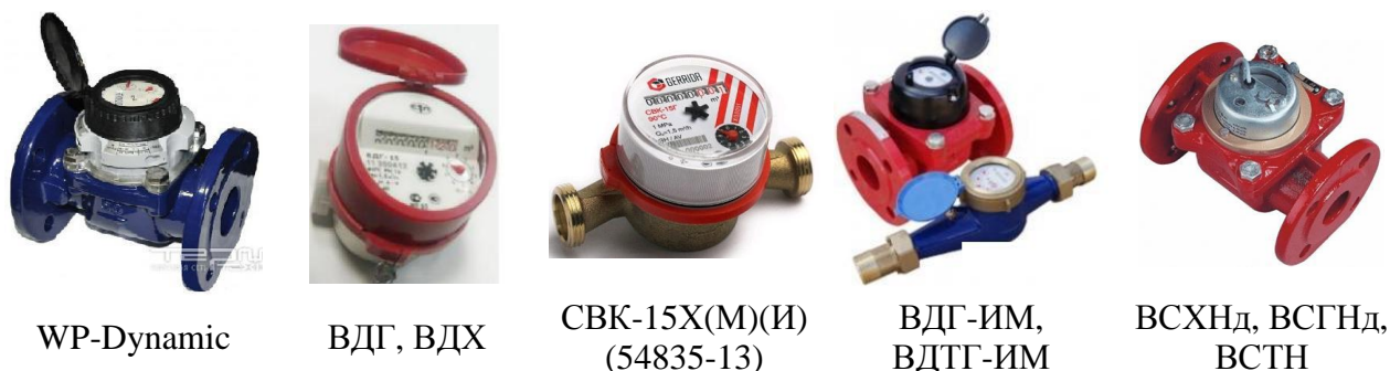
Рисунок 4.2 - Общий вид прочих ИП